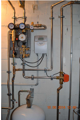
Solarstation, 3- Weg-Ventil, Solar-Regler und Verrohrung