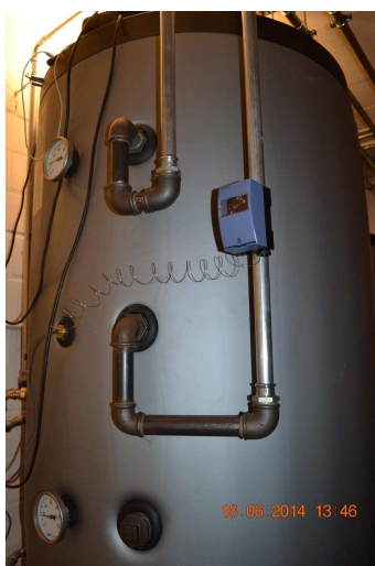
Solarspeicher mit Thermo-Siphon